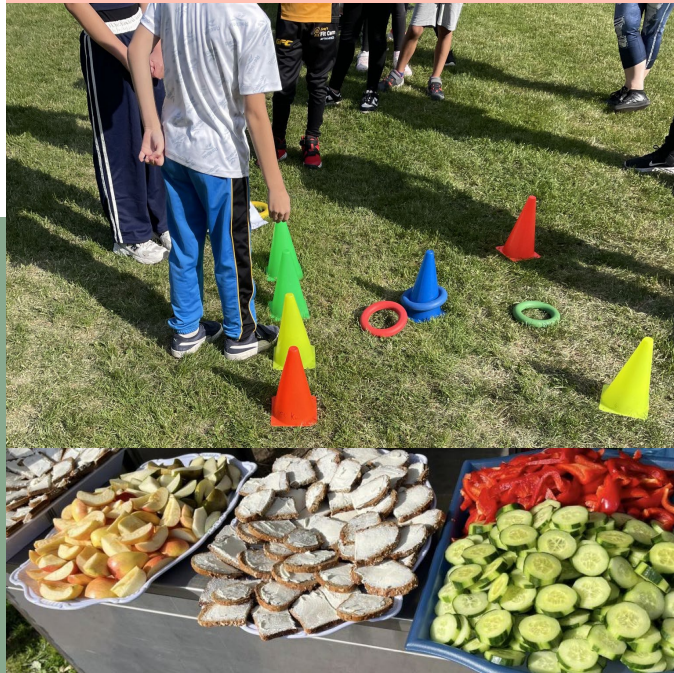
Gesundes Frühstück beim Sportfest